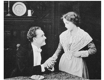
1917 LA PETITE CHÂTELAINE (Wee Lady Betty) de Charles Miller avec Frank Borzage