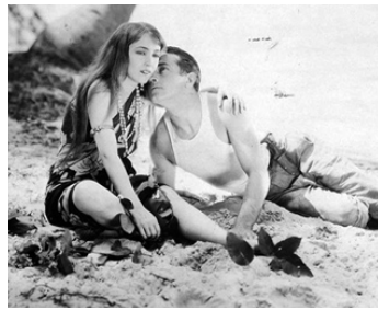
1925 SOUL FIRE de John Stuart Robertson avec Richard Barthelmess