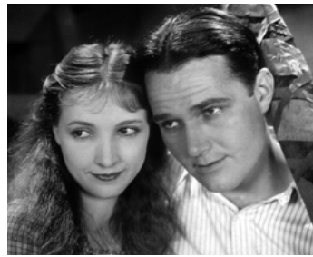
1926 ADORABLE MARIE (Lovely Mary) de King Baggot aec William Haines