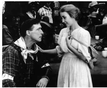
1916 POUR SAUVER SA RACE (The Aryan) de W. S. Hart & Reginald Barker avec William S. Hart