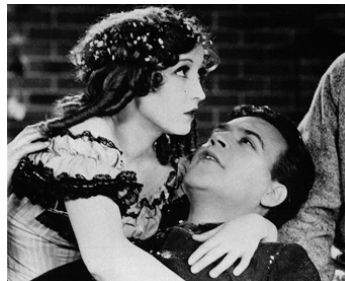
1928 BESSIE À BROADWAY (The Matinee Idol) de Frank Capra avec Johnnie Walker