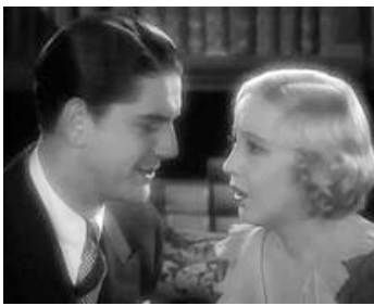
1930 CONSPIRATION (Conspiracy) de Christy Cabanne avec Ned Sparkes