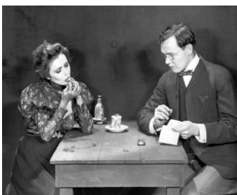
1924 DYNAMITE SMITH (Dynamite Smith) de Thomas H. Ince avec Charles Ray