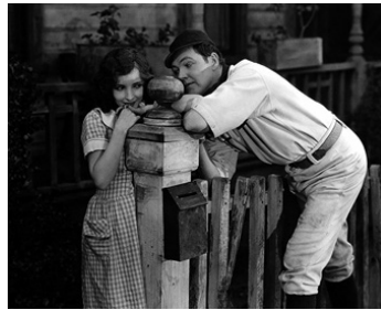
1927 THE AMERICAN de John Stuart Blackton avec Charles Ray