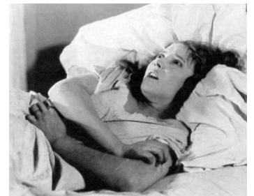
1923 DÉCHÉANCE HUMAINE (Human Wreckage) de John Griffith Wray