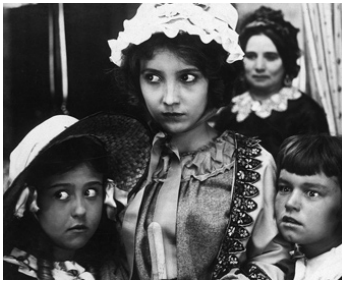
1916 LA CONQUÊTE DE L'OR (A Sister of Six) de Sydney & Chester Franklin