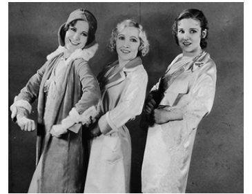
1930 BONNES NOUVELLES (Good News) de Nick Grinde avec Lola Lane, Mary Lawlor