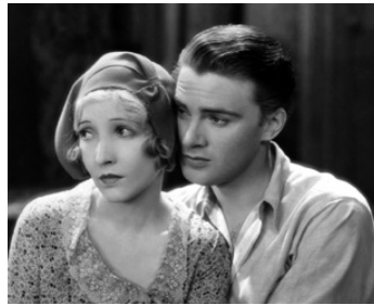
1929 THE GIRL IN THE SHOW d'Edgar Selwyn avec Raymond Hackett