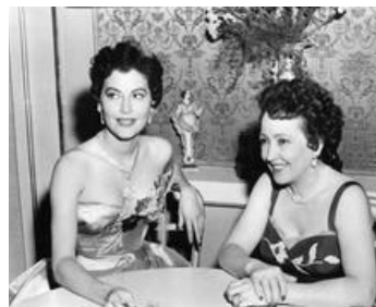
1954 LA COMTESSE AUX PIEDS NUS (The Barefoot Contessa) de J. Mankiewicz avec Ava Gardner