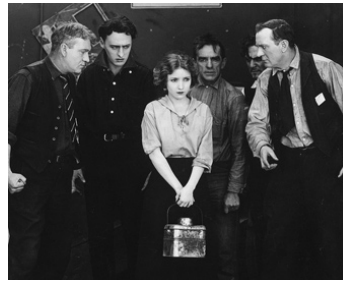
1917 A DAUGHTER OF THE POOR d'Edward Dillon avec , G. Beranger, Max Davidson, C. Stockdale