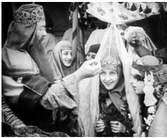
1915 INTOLÉRANCE (Intolerance) de David Wark Griffith (au centre)