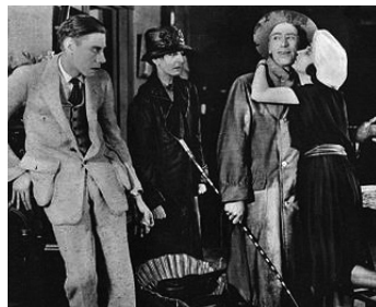
1922 LE FORGERON DU VILLAGE (The Village Blacksmith) de J. Ford avec William Walling