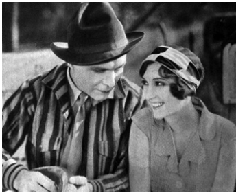
1926 RUBBER TIRES d'Alan Hale avec Harrison Ford