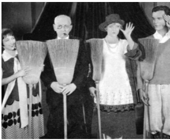
1925 NEW BROOMS de William C. De Mille avec Phyllis Haver, R. McWade, Neil Hamilton