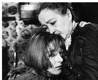
1968 ISADORA (Isadora) de Karel Reisz avec Vanessa Redgrave