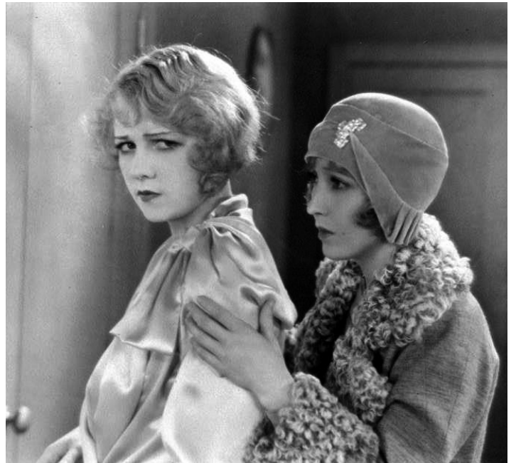
1929 BROADWAY MELODY (Broadway Melody) de Harry Beaumont avec Anita Page