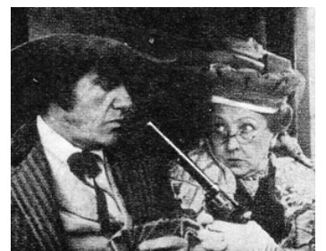
1971 CATLOW (Catlow) de Sam Wanamaker avec Richard Crenna