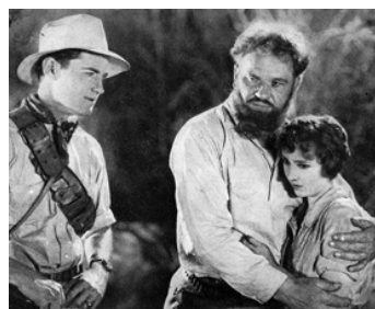
1925 LE MONDE PERDU (The lost World) d'Harry O. Hoyt avec Lloyd Hughes, Wallace Beery