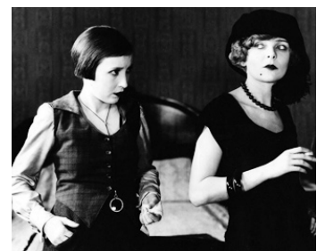
1924 THOSE WHO DANCE de Lambert Hillyer avec Blanche Sweet