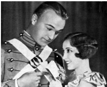
1927 SON BEAU GESTE (Dress Parade) de Donald Crisp avec William Boyd