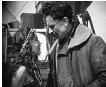
1921 LES CHASSEURS DE BALEINES (The Sea Lion) de Rowland V. Lee avec Hobart Bosworth