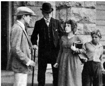
1920 THE MIDLANDERS de Joseph De Grasse et Ida May avec Jack Donovan, Lloyd Bacon