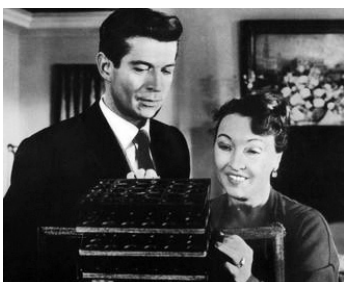
1958 LE CRIMINEL AUX ABOIS (Nowhere to go) de Seth Holt & B. Dearden avec George Nader