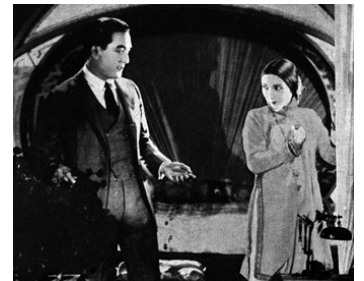
1921 LA COLÈRE DES DIEUX (The Vermillion Pencil) d'Allan Dwan avec Sessue Hayakawa