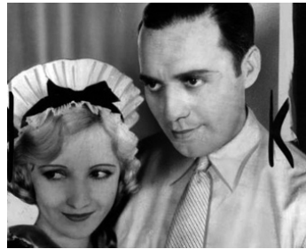
1929 CHASSEURS DE RÊVES (Chasing Rainbows) de Charles Reisner avec Jack Benny