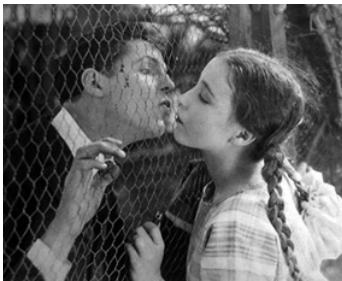
1922 L'ENFANT SACRIFIÉE (Forget me not) de W. S. Van Dyke avec Gareth Hughes