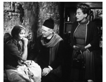
1957 LE SCANDALE COSTELLO (The Story of Esther Costello) de David Miller avec Joan Crawford