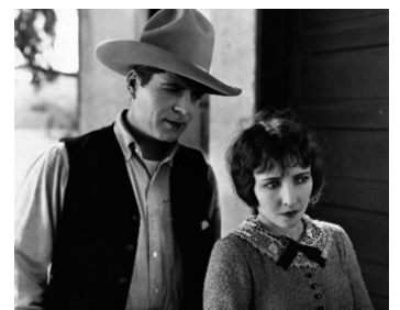
1925 LE FILS DE SON PÈRE (A Son of his Father) de Victor Fleming avec Warner Baxter