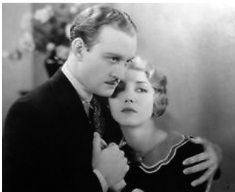
1929 IDLE RICH de William C. De Mille avec Conrad Nagel