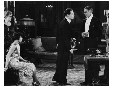
1926 MUSIC-HALL (The Song and Dance Man) d'Herbert Brenon avec H. Ford, Norman Trevor