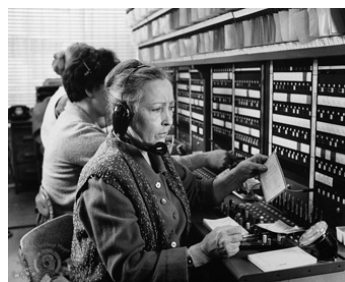
1971 UN DIMANCHE COMME LES AUTRES (Sunday bloody Sunday) de John Schlesinger