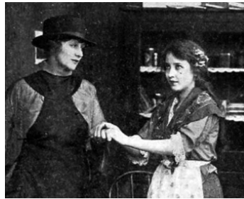
1917 NINA LA BOUQUETIÈRE (Nina, the Flower Girl) de Lloyd Ingraham avec Loyola O'Connor