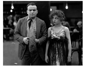
1916 TERRIBLES ADVERSAIRES (Reggie mixes in) de Christy Cabanne avec Douglas Fairbanks